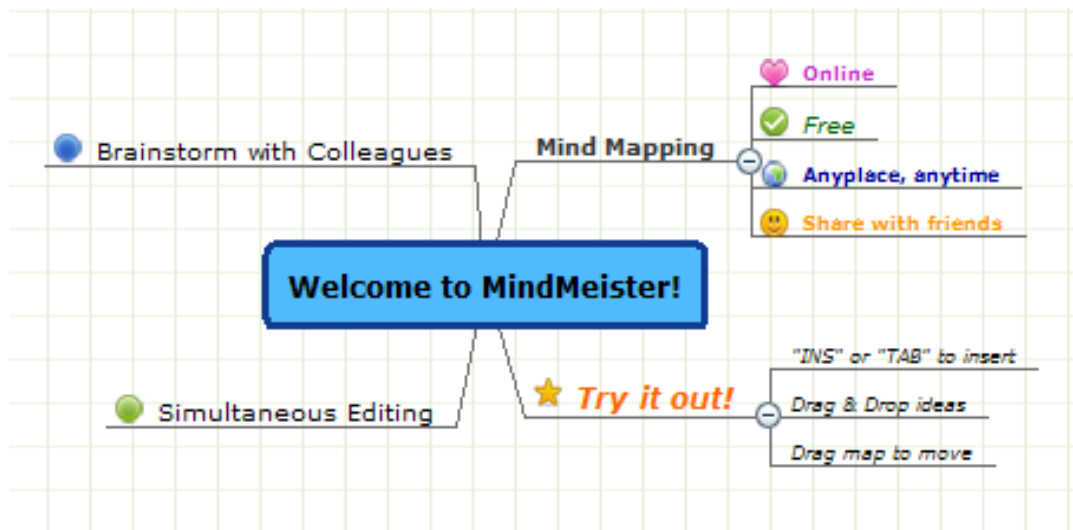
Figura 1. Haciendo mapas mentales con MindMeister

Permite a los usuarios compartir ideas colaborativamente y ayudar a traer ideas, planear proyectos y pensar visualmente. Los mapas se crean interpretando listas estructuradas de palabras o frases. Los estudiantes pueden construir mapas colaborativamente y editarlos sucesivamente. Las modificaciones anteriores se guardan en una lista de revisiones.