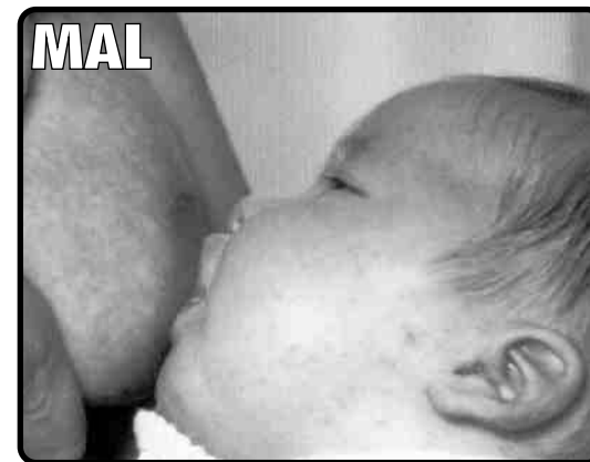
El bebé sólo coge el pezón.

Folleto elaborado por Vía Láctea para celebrar la Semana Mundial por la Lactancia Materna del año 2003, y ofrecer a las madres que llegan a Aragón desde otros países nuestra mejor bienvenida.