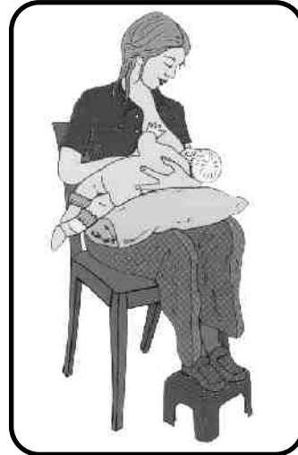
Imagen del folleto de Lactancia Materna de la Consejería de Salud de Andalucía.

La postura correcta Espalda recta. Hombros cómodos y relajados Acercar el bebé a la madre y no al contrario. El bebé se colocará frente a la madre barriga con barriga.