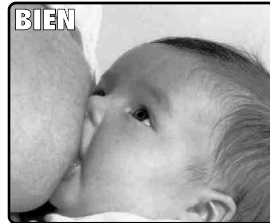
Imagen del folleto de Lactancia Materna de la Consejería de Salud Andalucía.

El bebé abarca con su boca el pezón y buena parte de la areola.