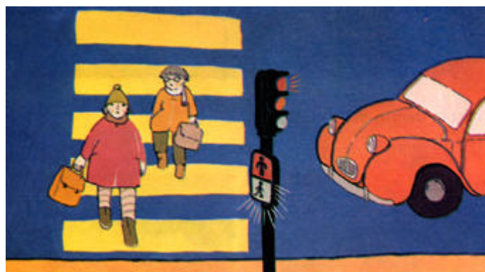
Desenlace (viñeta 4).