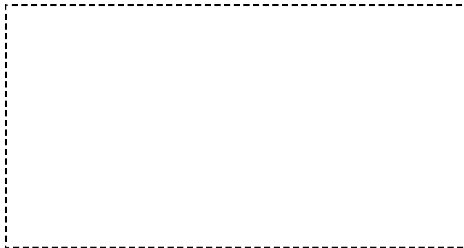
Presentación (viñeta 1)