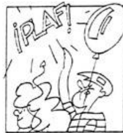
Nudo (viñeta 2).