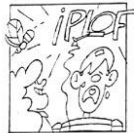
Desenlace (viñeta 4).