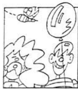
Nudo (viñeta 3).