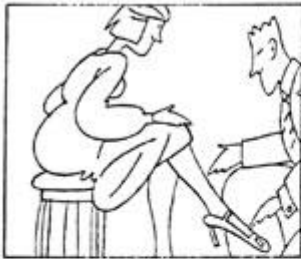
Presentación (viñeta 1).