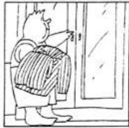
Presentación (viñeta 1).