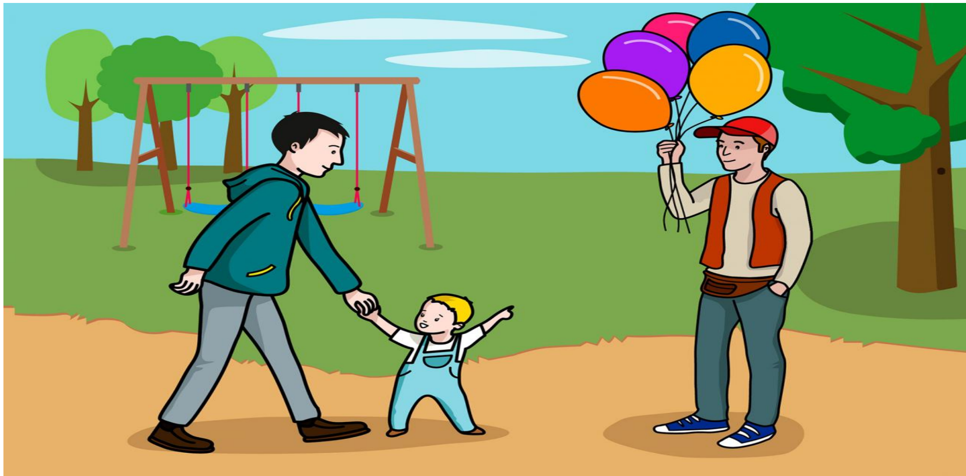
Lámina nº 1