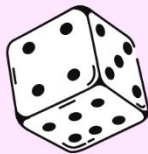
FIGURA N° 3

Cuando caigas en esta casilla, debes de inventarte una postura y realizarla durante 15 segundos.