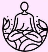
FIGURA N° 4

De dado a dado y tiro porque me ha tocado.