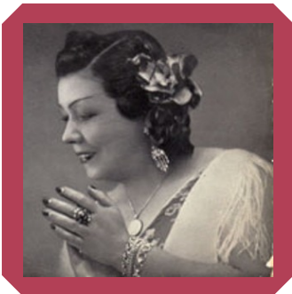
La Niña de los Peines