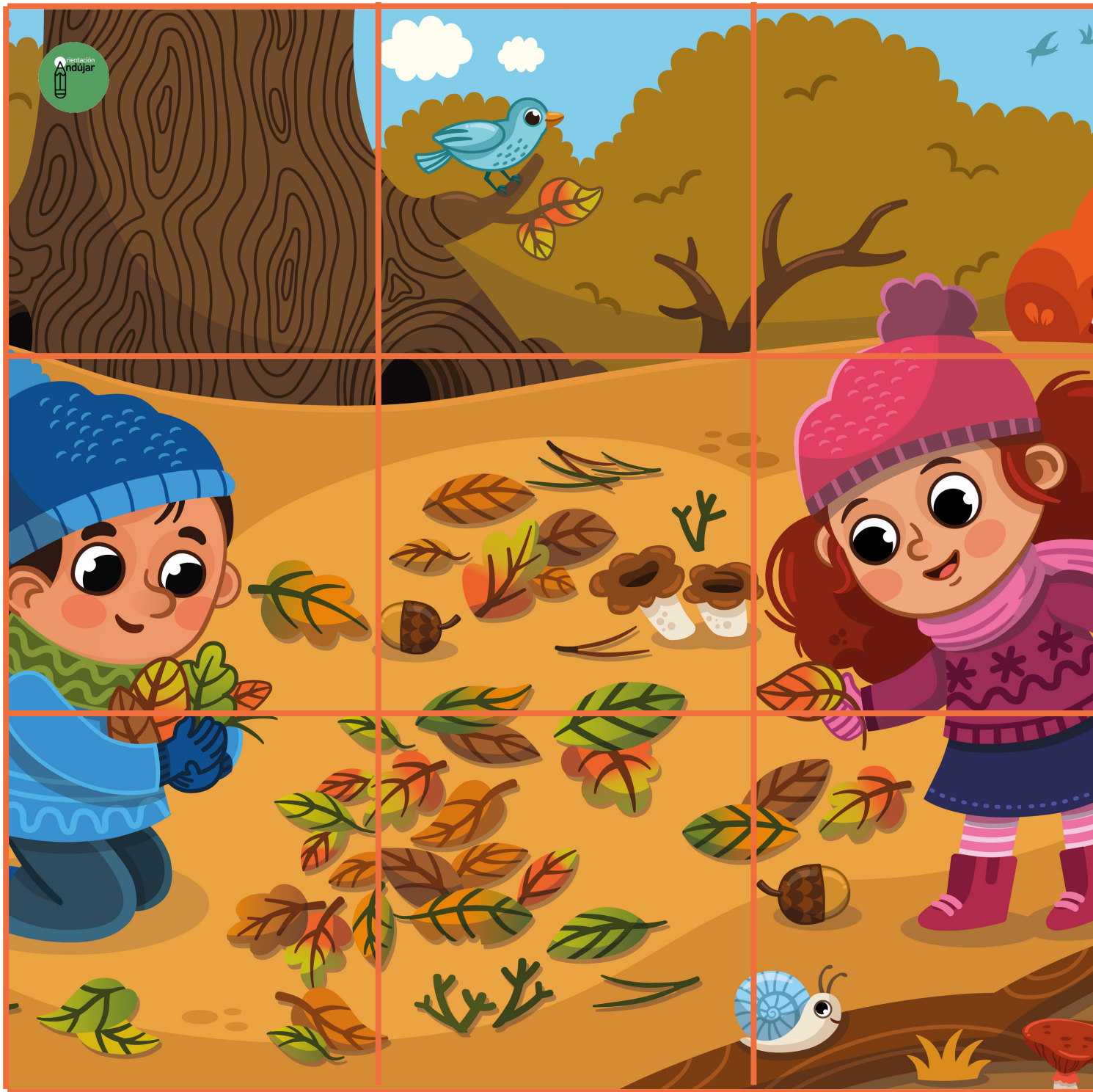
Tabla del 5