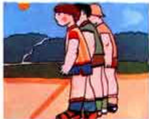
de pie/de espaldas