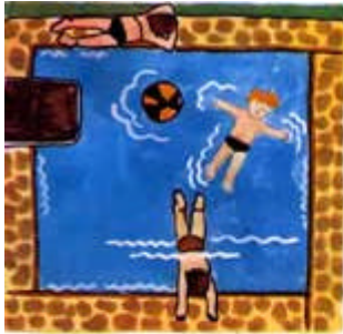
en la gasolinera/en la piscina