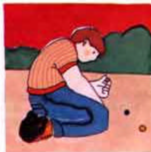
de frente/de rodillas