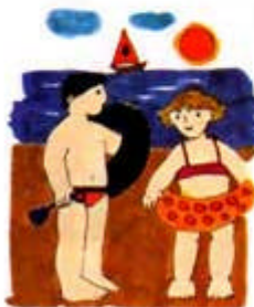
en la playa/en el comedor