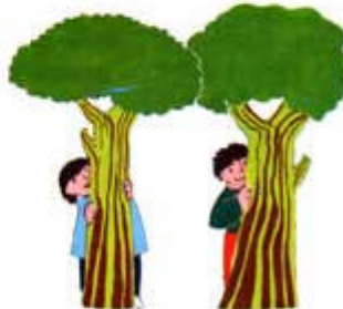
en el circo/en el parque