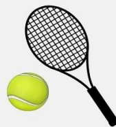
Cours de tennis