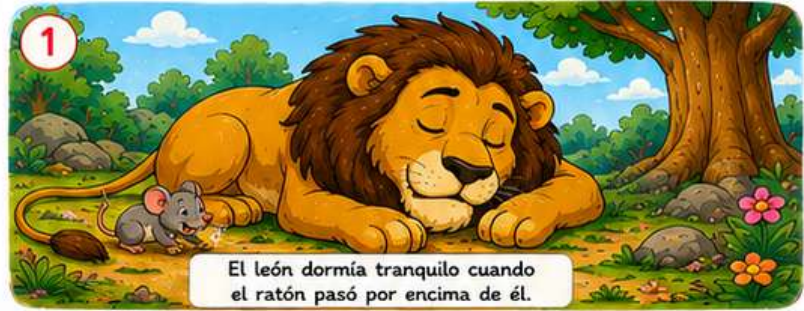
El león dormía tranquilo cuando el ratón pasó por encima de él.

Desde entonces, se hicieron grandes amigos.