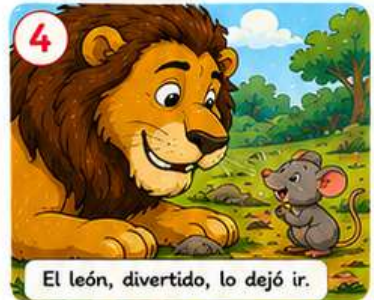
El león, divertido, lo dejó ir.