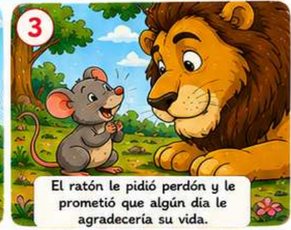
El ratón le pidió perdón y le prometió que algún día le agradecería su vida.