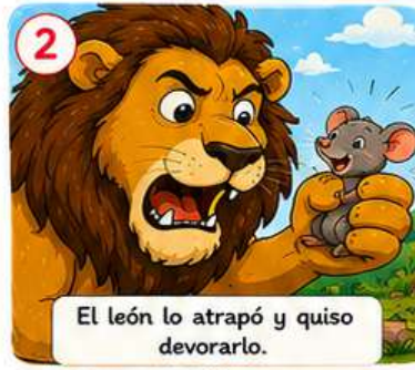
El león lo atrapó y quiso devorarlo.