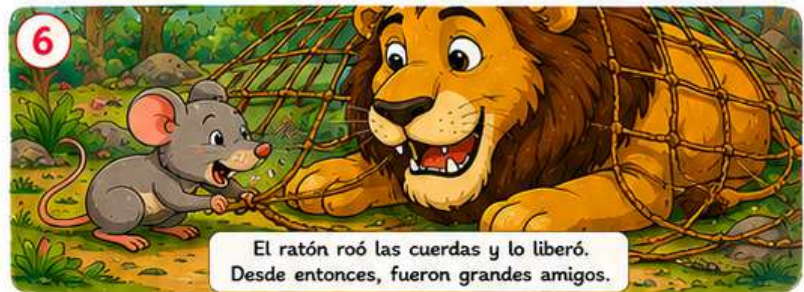
El ratón roó las cuerdas y lo liberó. Desde entonces, fueron grandes amigos.