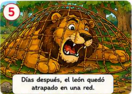
Días después, el león quedó atrapado en una red.