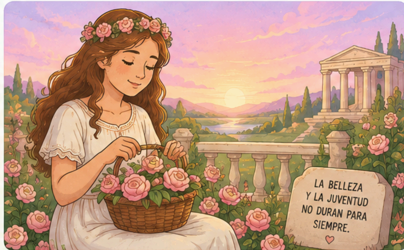
IMAGEN QUE LO REPRESENTA