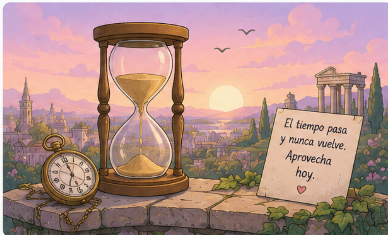
IMAGEN QUE LO REPRESENTA